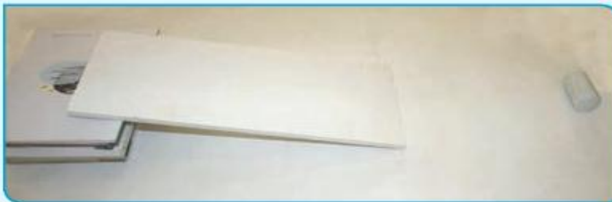
آزمایش روی سطح صاف

یک تخته‌ی صاف به طول تقریبی ۴۰ سانتی‌متر تهیه کنید و در یک سطح صاف مانند سطح سرامیکی، روی چند کتاب قرار دهید. جسمی مانند یک باتری قلمی را از بالای تخته رها کنید. جسم پس از طی چه مسافتی روی سطح صاف می‌ایستد؟ بار دیگر این آزمایش را روی سطح پرزدار مانند موکت تکرار کنید. این بار جسم پس از طی چه مسافتی می‌ایستد؟ اگر آزمایش را روی سطح ناهموار خاکی انجام دهیم، چه اتفاقی می‌افتد؟ اگر روی یخ انجام شود، چه اتفاقی می‌افتد؟ ● به نظر شما باید چه وضعیتی فراهم باشد تا جسم، مسافت بیشتری را طی کند؟ ● در کدام حالت جسم زودتر متوقف می‌شود؟ ● به نظر شما چرا در همه‌ی حالت‌ها، جسم پس از مدتی بالاخره می‌ایستد؟