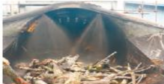
(۳) کندن پوست تنه درخت