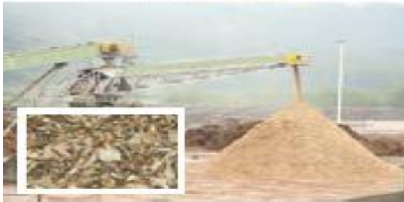
(۴) تبدیل به تکه‌های ریز چوب (چوبس چوب)