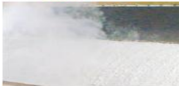
(۶) خشک کردن خمیر و تهیه کاغذ