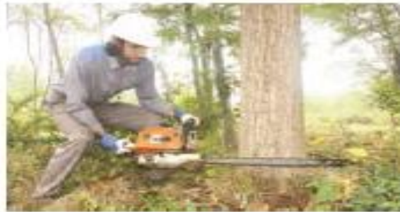
(۱) بریدن درخت