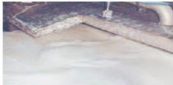
(۵) تبدیل تکه‌های ریز چوب به خمیر و از بین بردن رنگ آن

۱- تغییرهای انجام‌شده در هر یک از مرحله‌های (۴) و (۶) فیزیکی است یا شیمیایی؟