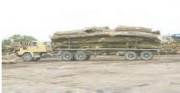
(۲) حمل اتوار چوب و تنه‌های درخت به کارخانه

از میان اجزای تشکیل دهنده درخت، فقط ساقه و تنه محکم و شاخه‌های چوبی درختان تنومند برای تهیه کاغذ مناسب است. در شکل‌های زیر، مراحل مختلف تبدیل درخت به کاغذ نشان داده شده است. با توجه به آنها و اطلاعاتی که جمع‌آوری کرده‌اید دریابید هر مرحله در کلاس گفت‌وگو کنید؛ سپس به پرسش‌ها پاسخ دهید.