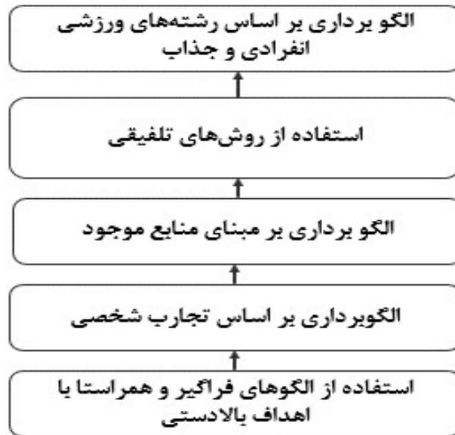
شکل ۱. مدل ساختاری-تفسیری الگوهای تدریس درس تربیت بدنی در مدارس چندپایه

گام هفتم؛ تحلیل میک مک (قدرت نفوذ و میزان وابستگی): تجزیه و تحلیل داده‌های میک مک یا اثرات متقابل چهار دسته اصلی از متغیرها و اهمیت نسبی آن‌ها را به‌عنوان تابعی از وابستگی متقابل و قدرت محرک برای هر متغیر نشان می‌دهد (نمودار ۱). خوشه خودمختار: خوشه اول خودمختار نام دارد. این عوامل، قدرت نفوذ و میزان وابستگی پایینی دارند و در نتیجه تأثیر کمی بر کل سیستم دارند. در این خوشه، هیچ عاملی گنجانده نشده است. خوشه وابسته: در این خوشه، شاخص یا الگوهای از جمله استفاده از روش تلفیقی، الگوپردازی بر اساس رشته‌های ورزشی انفرادی و جذاب گنجانده شده است. خوشه پیوندی: تنها یک عامل در این خوشه قرار دارد که عبارت است از الگوپردازی بر مبنای منابع موجود. در نهایت خوشه مستقل: استفاده از الگوهای فراگیر و همراهی با اهداف بالادستی و الگوپردازی بر اساس تجارب شخصی مهم‌ترین شاخص یا الگوهای هستند که در این خوشه قرار گرفتند.